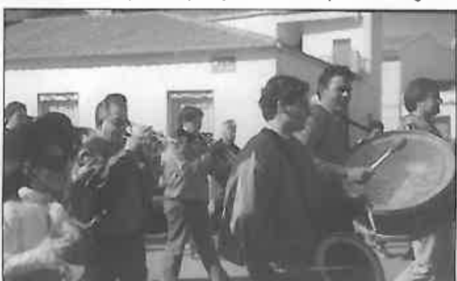
Las charangas ponen la nota musical a todos los actos de nuestro Carnaval

del Domingo de Piñata, donde una peña debutante en Miguelturra se llevó las 400.000 ptas. del premio especial. También destacaron las peñas del Almagro, la de Pedro Muñoz y la de Daimiel —estos últimos algo más cansados por el «circuito» de toda la semana—. Por las locales, El Bufón y La Cabra volvieron a dejar claro que aún mantienen ilusión por este concurso. Resaltar también la labor de los voluntarios de Protección Civil, el club de Radioaficionados Alarcos, Guardia Civil, Policía Local y los miembros de la Emisora Local de Radio, para que el desfile resultara lo más vistoso y ágil posible.