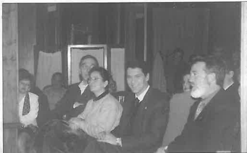
Asistieron al acto autoridades locales y regionales