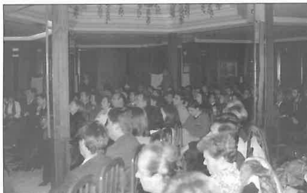
La asistencia de público fue numerosísima

Tras la entrega de premios se ofreció un vino de honor en una gala que resultó sencilla y brillante al mismo tiempo, y que justificó su celebración por la calidad y nivel cada año más elevado de los deportistas migueltureños.