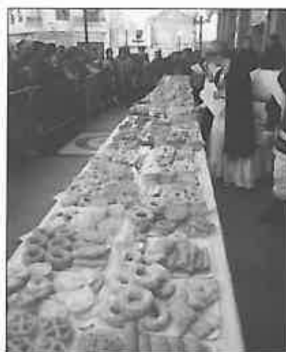
Los dulces de Carnaval tienen cada vez más aceptación

Por lo demás, también menor participación en el Entierro de la Sardina, a pesar de lo agradable de la tarde del miércoles festivo, y mayor calidad en las peñas participantes en el Concurso de peñas