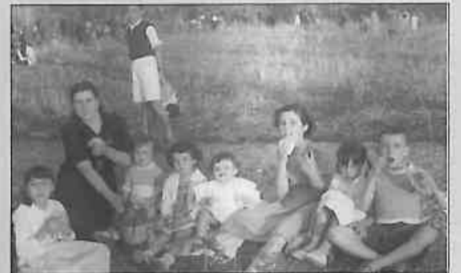
Seguimos de campo, pero ahora en plan festivo, se trata de la romería de San Miguel en las Huertas de la Poblachuela (1954).