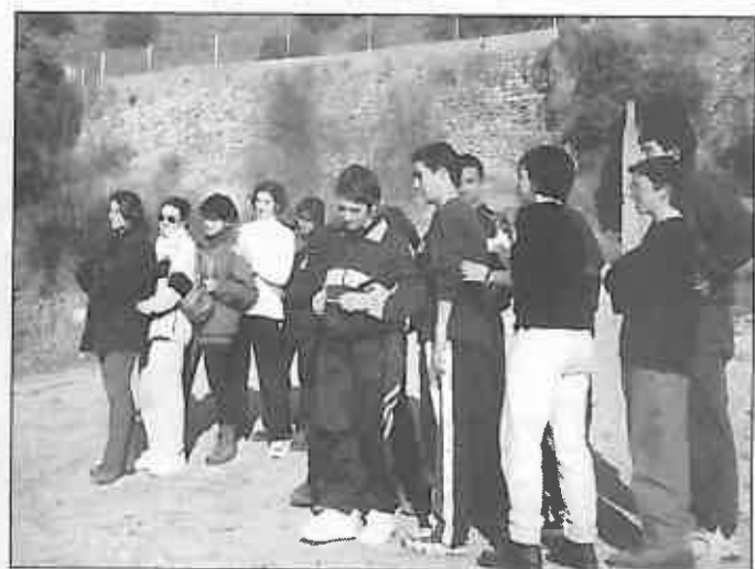
Miembros del Aula Joven en el Parque Natural de las Lagunas de Ruldera

Bueno amigos, nos despedimos, pero tendréis noticias nuestras muy pronto.