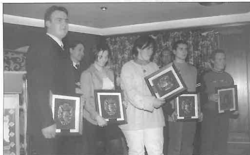
Estos fueron los cinco nominados

Es esta una fecha simbólica y que quiere mantener su mensaje reivindicativo para que toda la sociedad se a consciente de la necesidad que las personas tenemos de proteger el medio ambiente, destacando en el árbol el protagonismo de esta jornada.