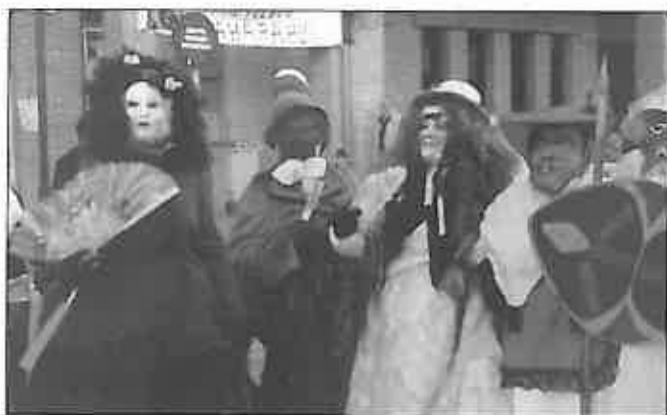
La Máscara Callejera mantiene su real protagonismo en nuestra fiesta