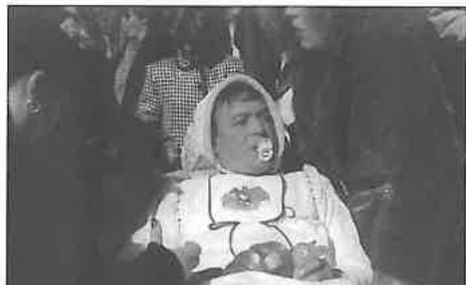
La imaginación y la picardía se dan la mano en las máscaras miguelturreñas