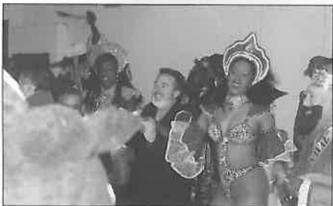
Canarias, Brasil y Miguelturra unieron sus carnavales en el pregón 1999