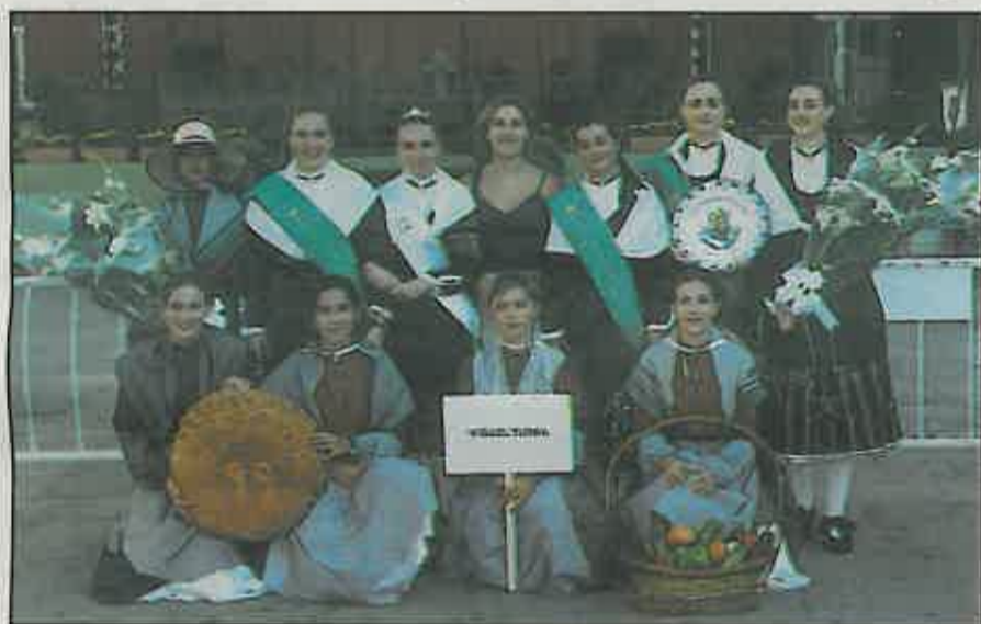
La reina y damas participaron como en años anteriores en la Pandorga representando a Miguelturra