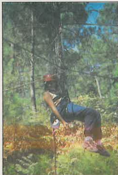
Los jóvenes disfrutaron con «la tirolina»

Según se desprende del cuestionario que rellenaron los participantes el último día, todos están entusiasmados con el campamento, manifestando su intención de participar en próximas ediciones. En estos momentos el equipo de educadores, evalúa el aprendizaje de los niños durante este periodo, dado que el campamento escuela está concebido como un instrumento para la Educación Ambiental, donde se combinan el juego con el aprendizaje a través de la investigación-acción.