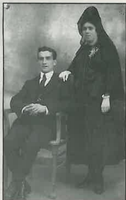
4. En esta otra fotografía correspondiente al año 1922, podemos ver una pareja de Novios.