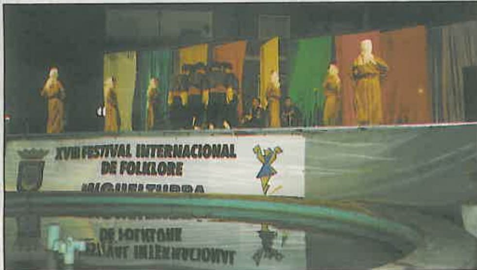
La Plaza de la Constitución fue el escenario del XVIII Festival Internacional de Folklore

El mes de julio, con una noche preciosa de viernes, cerró con música y color en la Plaza de la Constitución: más de 1.500 personas fueron testigos de excepción de un festival de folklore que, a pesar de sus tres horas de duración, pasó rápido para la mayoría de los espectadores.