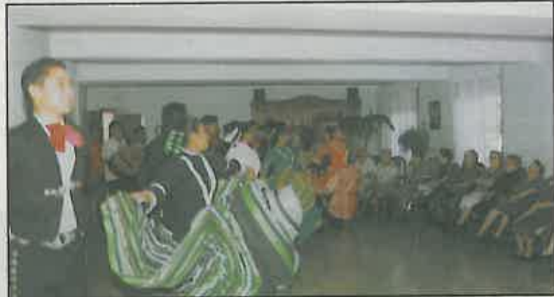
Como en ediciones anteriores, los participantes del Festival visitaron la Residencia de Ancianos

Además, gracias a la gestión del grupo Nazarín, Miguelturra se convierte durante cinco días (tiempo que los grupos extranjeros pasaron en nuestro pueblo) en sede provincial que este festival, que es también llevado a otras poblaciones como Puertollano o Argamasilla de Alba, sin que ello suponga un mayor gasto para nuestro ayuntamiento en relación con los de otros pueblos. Además ello permite la programación de otras actividades en nuestro pueblo sin coste adicional, como son las actuaciones realizadas durante el día 31 de julio y 1 de agosto en la residencia de ancianos de Miguelturra, y a la que asistieron la mayoría de los residentes y del personal que lo gestiona; no pudiendo