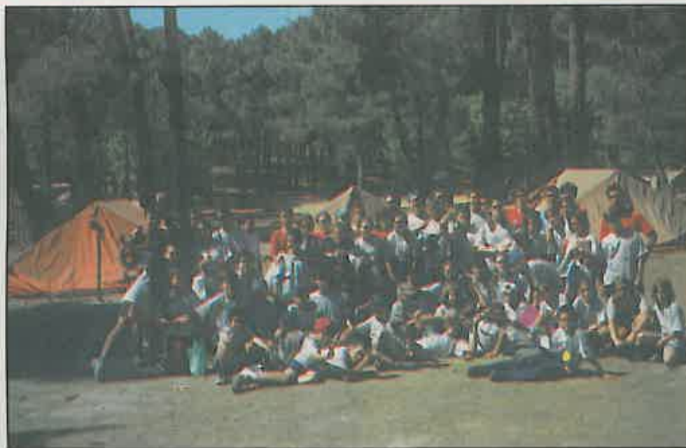
Monitores y participantes del Campamento «Riopar '99»

Del 1 al 15 del pasado mes de agosto, se desarrolló la XI Edición del Campamento Escuela de la Naturaleza, RIOPAR '99, situado en la Sierra de Alcaraz y con el incomparable marco de la Cueva de los Chorros y nacimiento del río Mundo, como escaparates naturales.