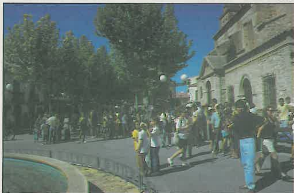
La Plaza de la Constitución congregó a cientos de personas para observar el eclipse