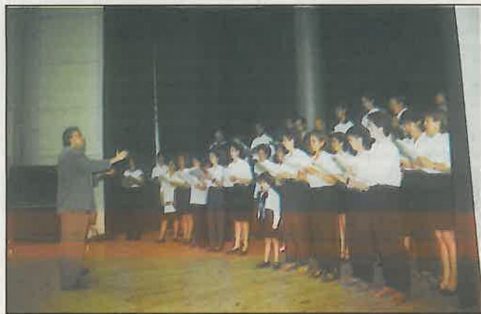
La Coral de la Escuela de Música participó en la clausura del curso 1998-99

Posteriormente se produjo el debut de nuestra coral polifónica con los nervios propios que requiere tal evento ya que la mayoría de la gente que la integra, no ha actuado nunca frente al público, fue entonces cuando pudimos comprobar la entrega,