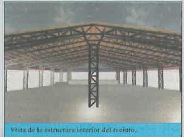
Vista de la estructura interior del recinto.