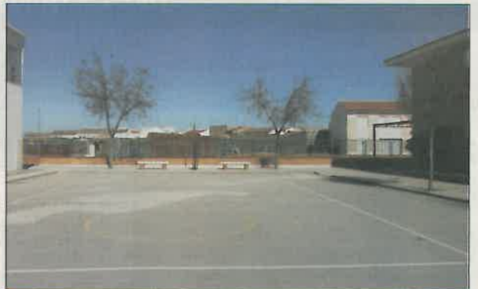
El colegio de la calle Ancha ampliará sus instalaciones.

Con esta futura construcción se quiere sustituir definitivamente el viejo edificio de la plaza de Pradillo de Clavería, que ha quedado totalmente desfasado para su uso docente. (M.G.R.)