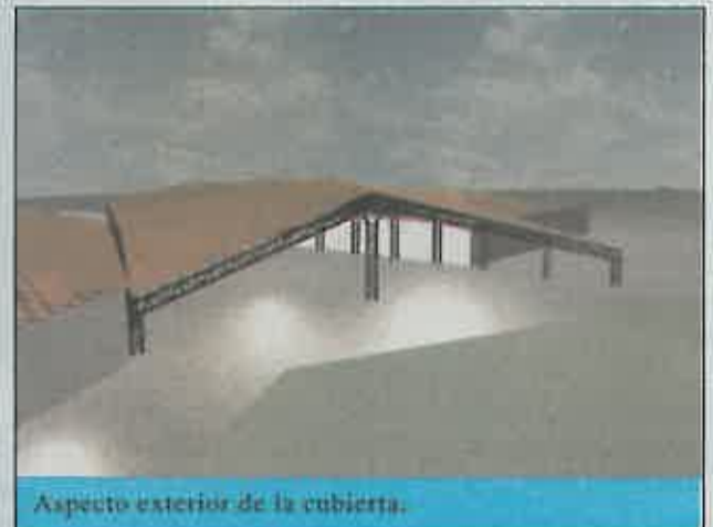
Aspecto exterior de la cubierta.