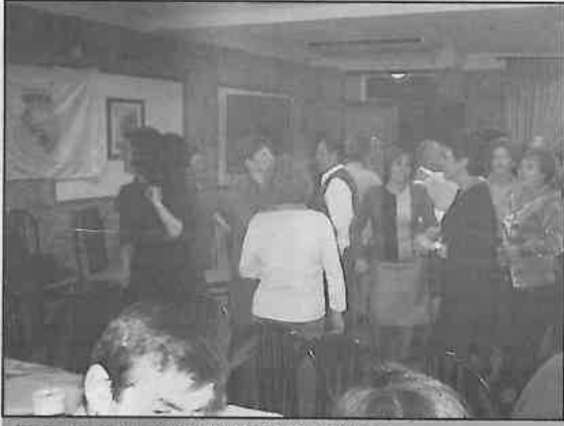
La mayoría de los comensales participaron de la fiesta.

El primero de ellos tuvo lugar el día 5, con la cena anual que se celebró en un restaurante de la localidad y en la que participaron cien personas, entre socios y simpatizantes y que terminó con un animado baile, amenizado con música en vivo. Además se hizo entrega de diversos obsequios a los asistentes, destacando una camiseta, con un diseño especial para la Peña, y