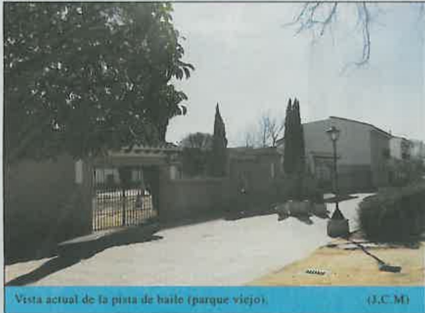
Vista actual de la pista de baile (parque viejo).

Cada vez son mayores las necesidades que Miguelturra ha de cubrir en todos los ámbitos. La vida cultural de nuestro pueblo, sustentada por los muchos colectivos y por la respectiva área municipal, mantiene un nivel de actuación muy importante, haciendo así crecer cada vez más la demanda de instalaciones, que poco a poco se van cubriendo. Ahora nuestro ayuntamiento proyecta una nueva obra de tipo cultural: la construcción de un auditorio multifuncional cubierto