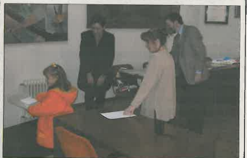
Momento de la entrega de los diferentes premios.

Del 7 al 13 de febrero el salón de actos del ayuntamiento se convirtió en el mejor lugar para contemplar las estrellas celestes, ya que durante esos días y prácticamente en sesión continua permaneció abierto el "Planetario Viajero" de la Fundación LA CAIXA.