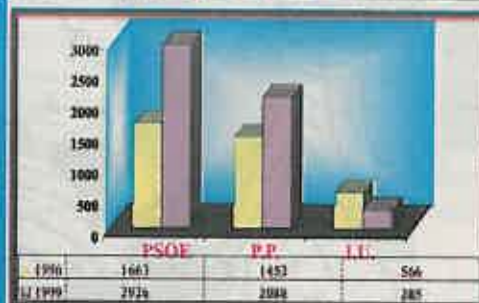
Datos comparados elecciones generales '96 y europeas '99