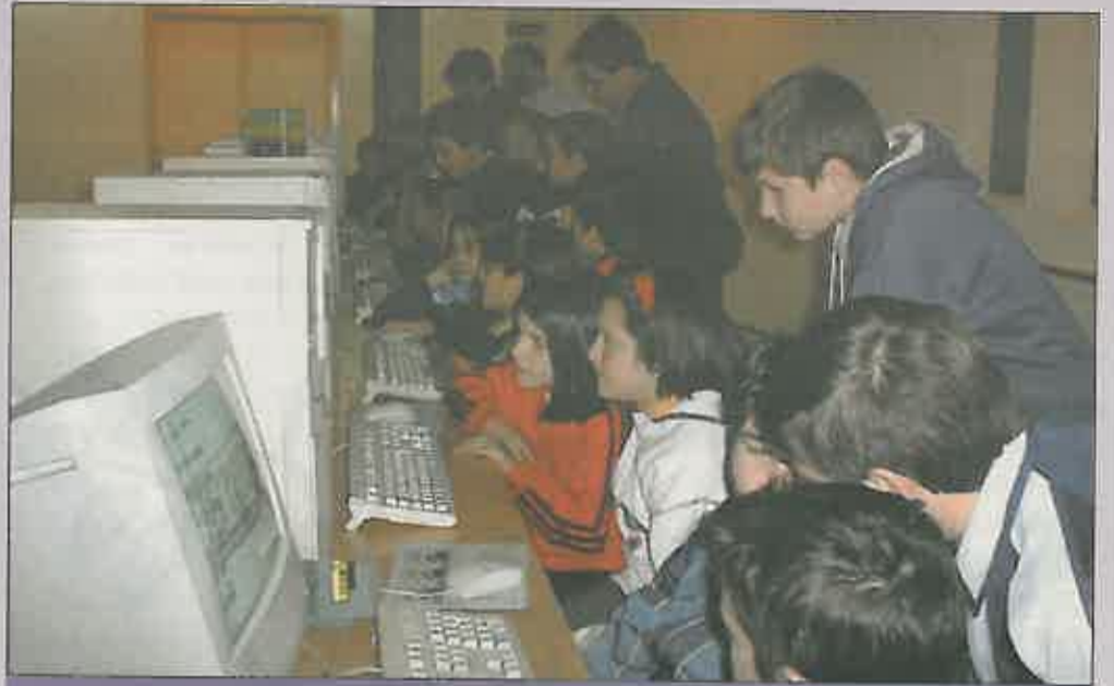
Escritores-cuentos de cuentos y jubilados experimentaron en el mundo de Internet.

El número de participantes ha sido de 400 aproximadamente, habien-